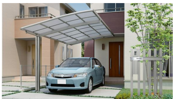
片流れ、ポリカのカーポート