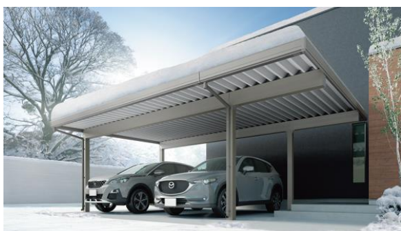
折板屋根のカーポート

カーポートは屋根材がポリカで片屋根が主流でしたが、山陰では台風の風害により屋根が飛んで行ったり、大雪の雪害により屋根が割れたり、カーポート自体がつぶれたりする被害を受ける事が多いです。